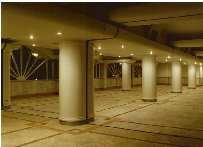
طرح های پردیس مرکز تجارت و فاینانس ایران ( کار فرما : شرکت بین المللی نیکی ) :